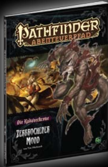
Teil 3: Zerbrochener Mond Art.-Nr. US53024 ISBN 978-3-86889-173-7