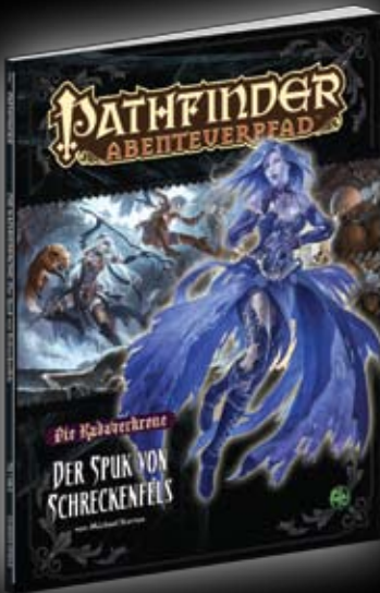
Teil 1: Der Spuk von Schreckenfels Art.-Nr. US53022 ISBN 978-3-86889-171-3