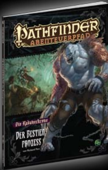
Teil 2: Der Bestienprozess Art.-Nr. US53023 ISBN 978-3-86889-172-0