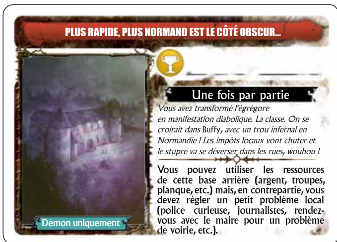
Illustration : Olivier Sanfilippo