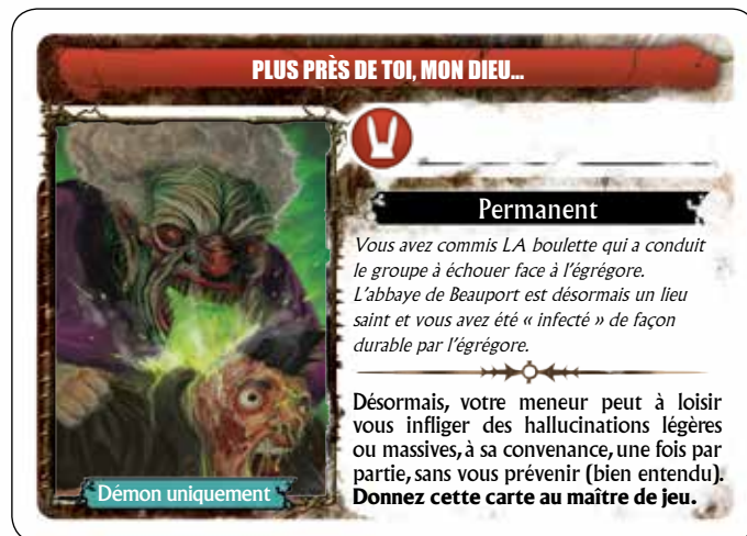
Illustration : Boris Moncel

RETROUVEZ LES CARTES PROUESSE DANS LA PARTIE TÉLÉCHARGEMENT DU SITE WWW.RAISE-DEAD.COM