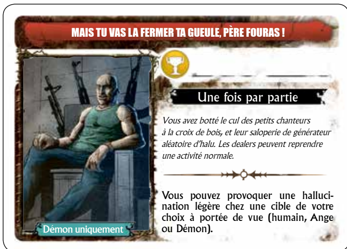
Illustration : Stéphane Cochetoux