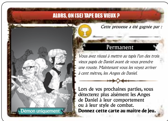
Illustration : Radja Sauperamaniane