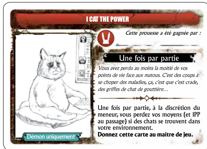
Illustration : Radja Sauperamaniane