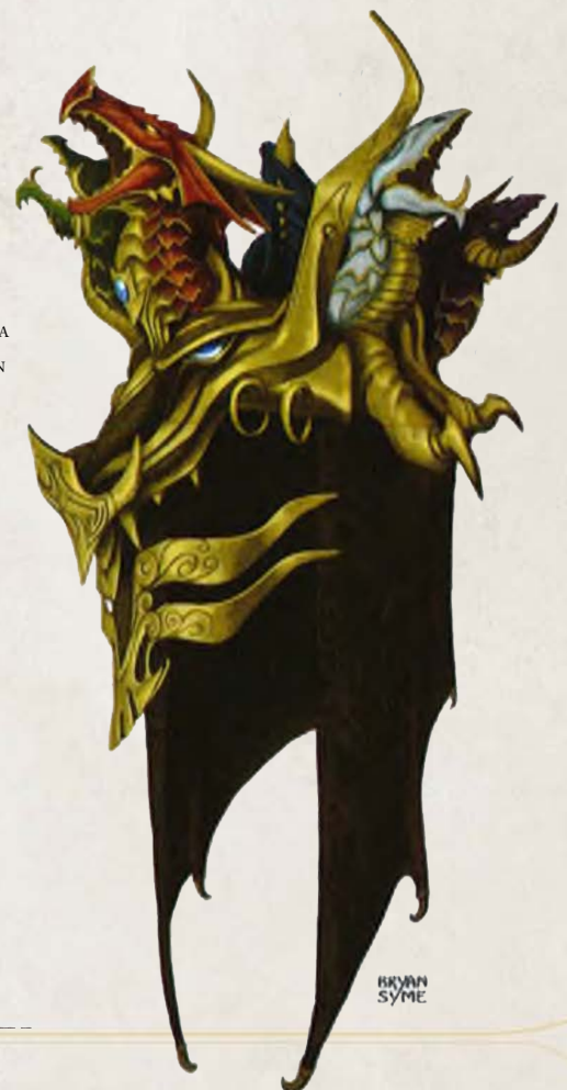
MÁSCARA DE LA REINA DRAGÓN