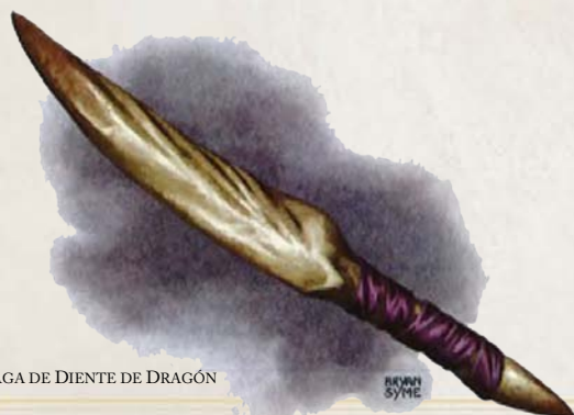
DAGA DE DIENTE DE DRAGÓN

El bloque de estadísticas de Severin incorpora las propiedades de la Máscara del Dragón Rojo. Puedes encontrar las estadísticas de las cinco máscaras de dragón en el suplemento online disponible en DungeonandDragons.com .