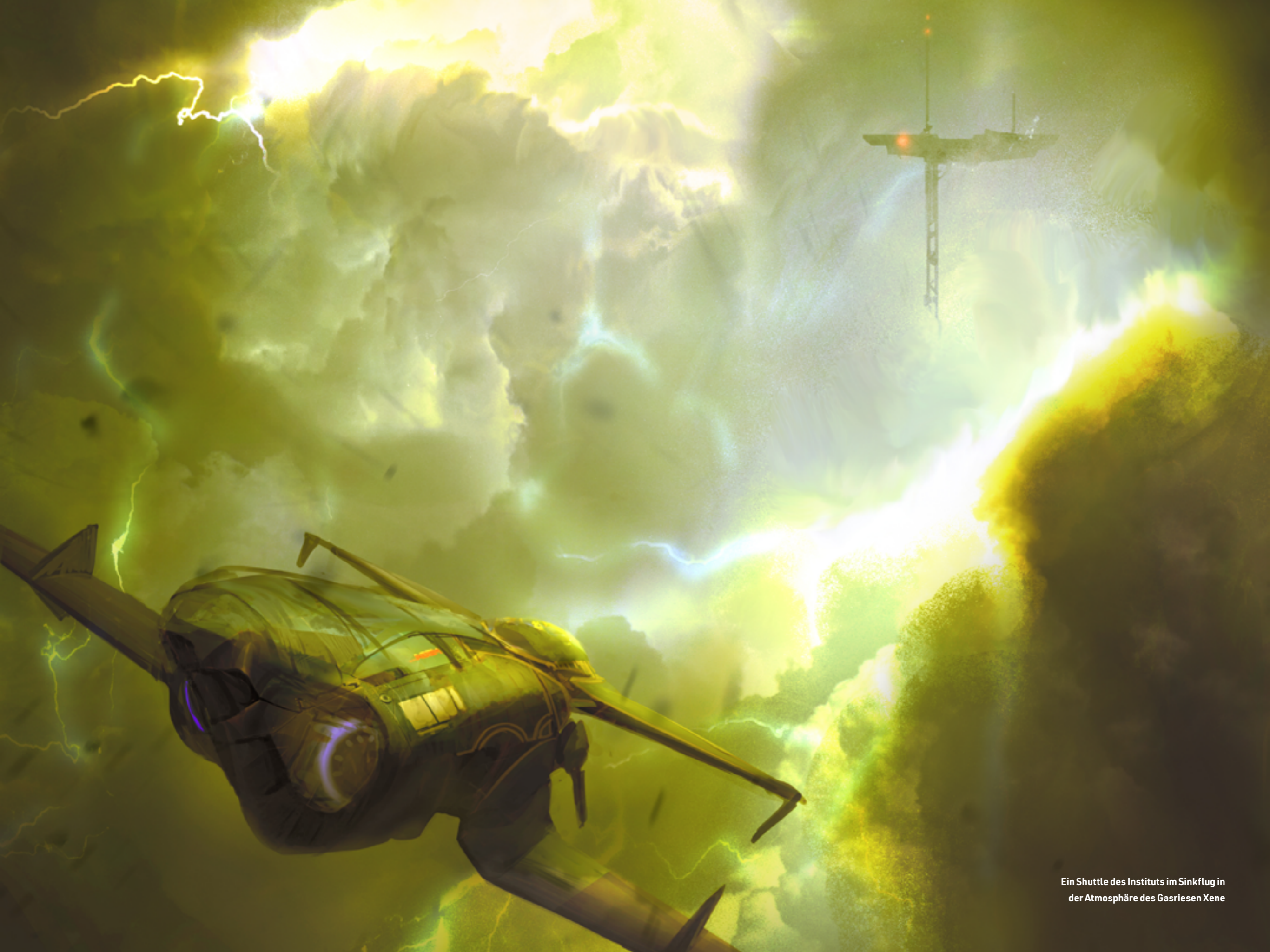
Ein Shuttle des Instituts im Sinkflug in der Atmosphäre des Gasriesen Xene