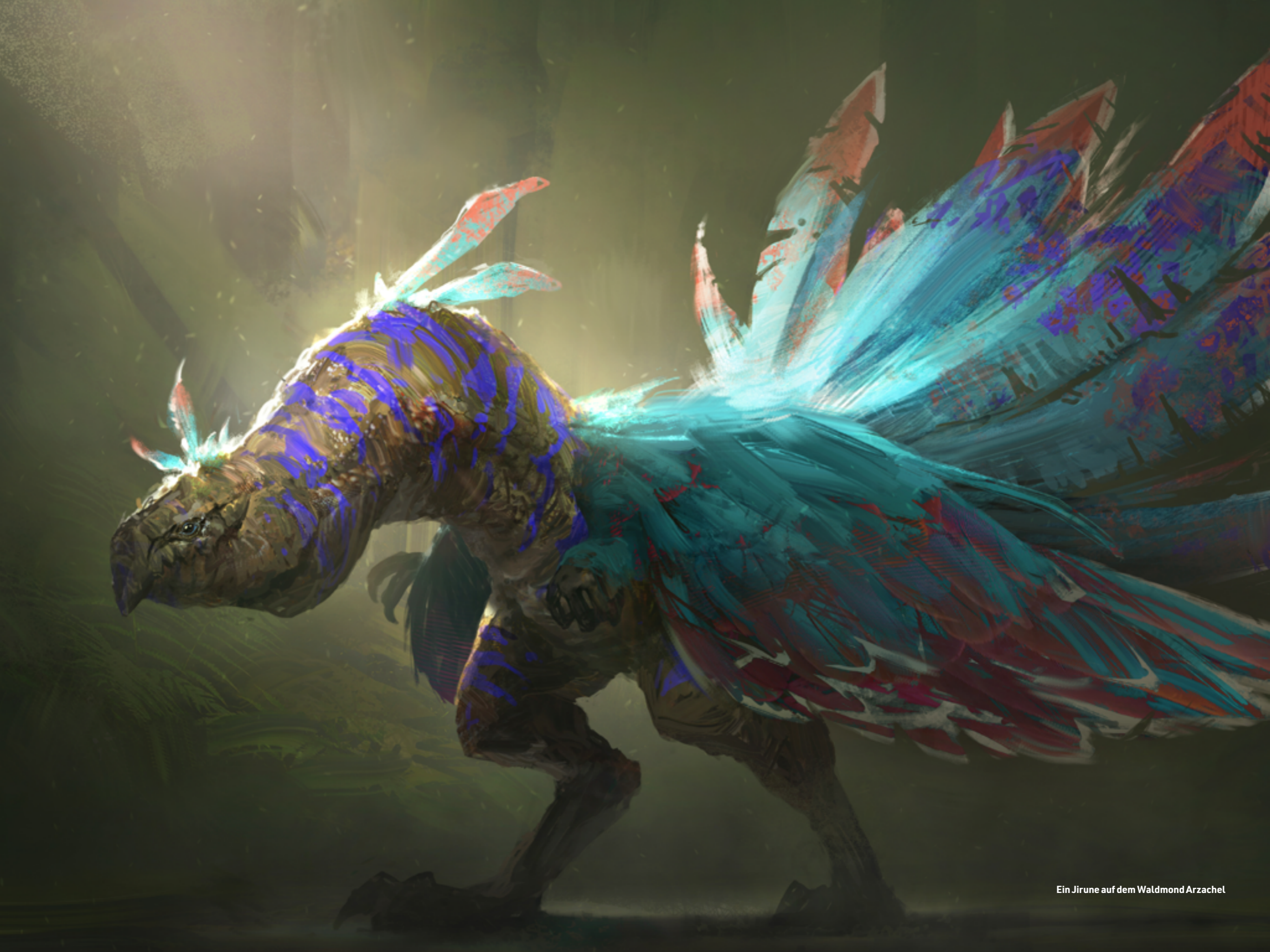
Ein Jirune auf dem Waldmond Arzachel