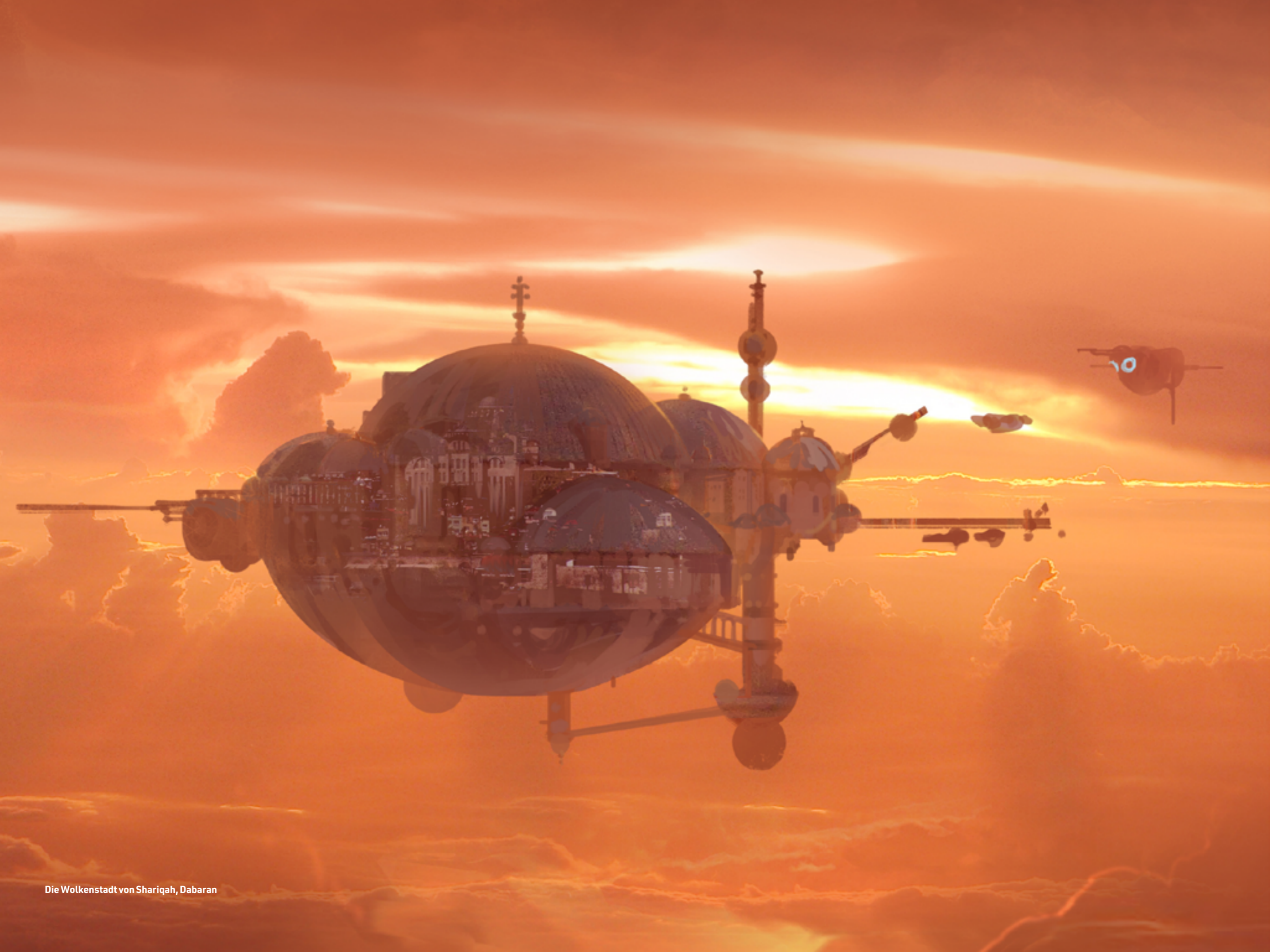
Die Wolkenstadt von Shariqah, Dabaran