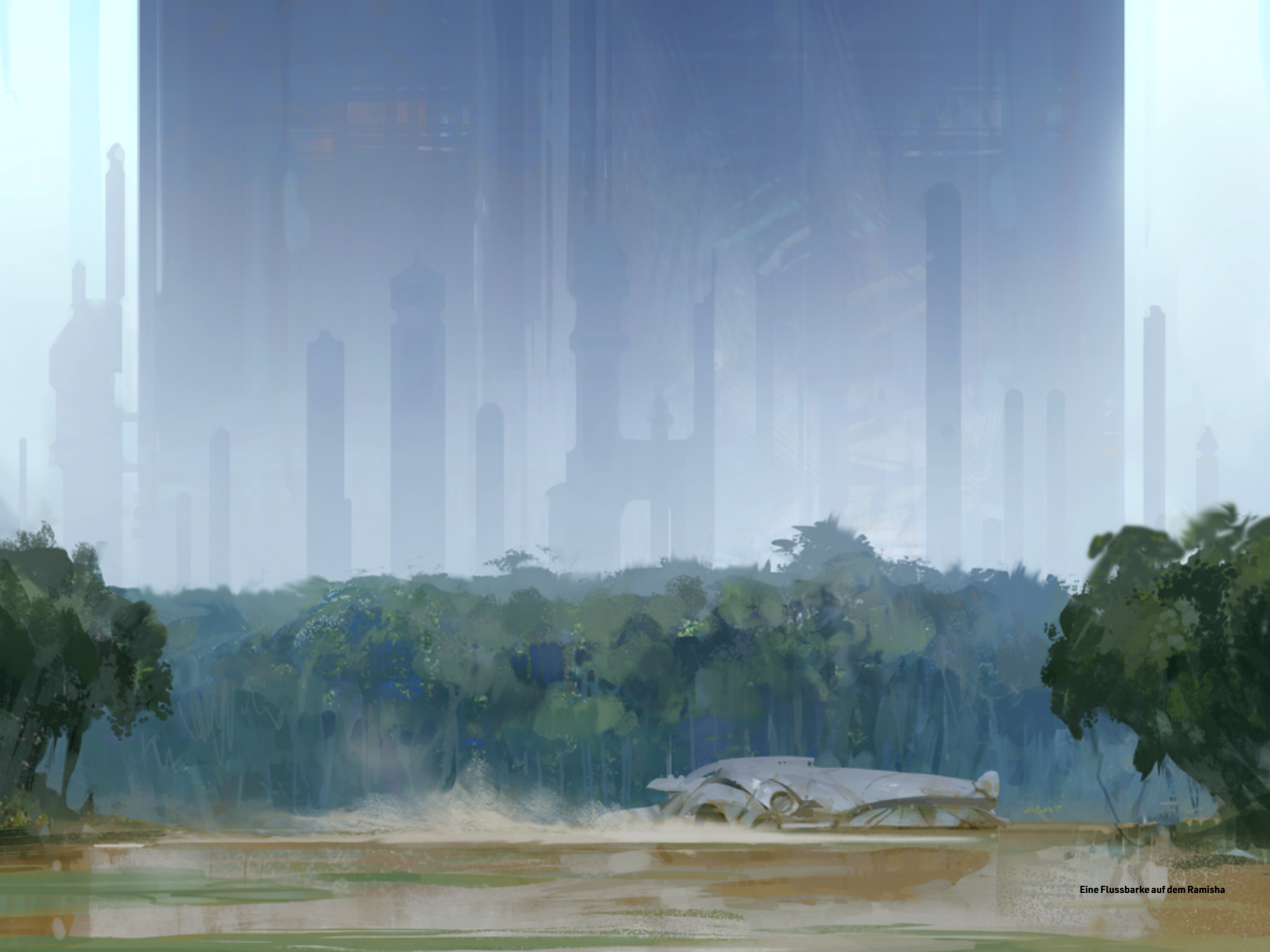
Eine Flussbarke auf dem Ramisha