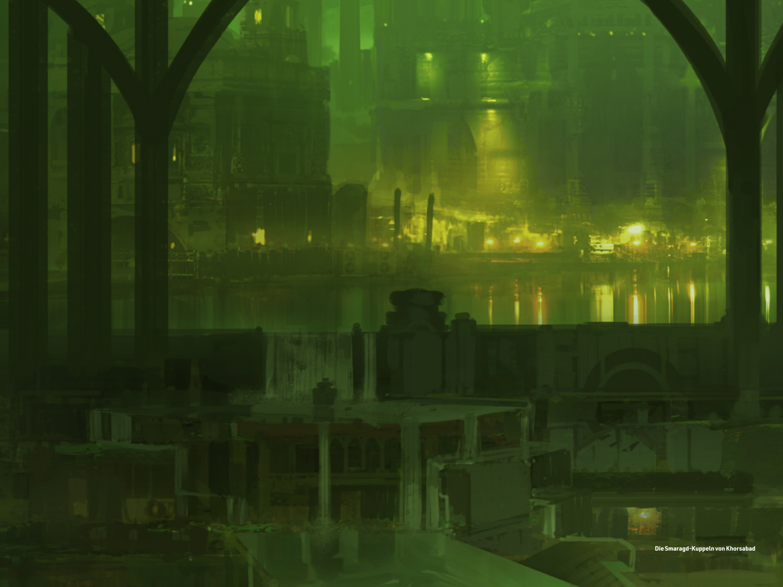
Die Smaragd-Kuppeln von Khorsabad