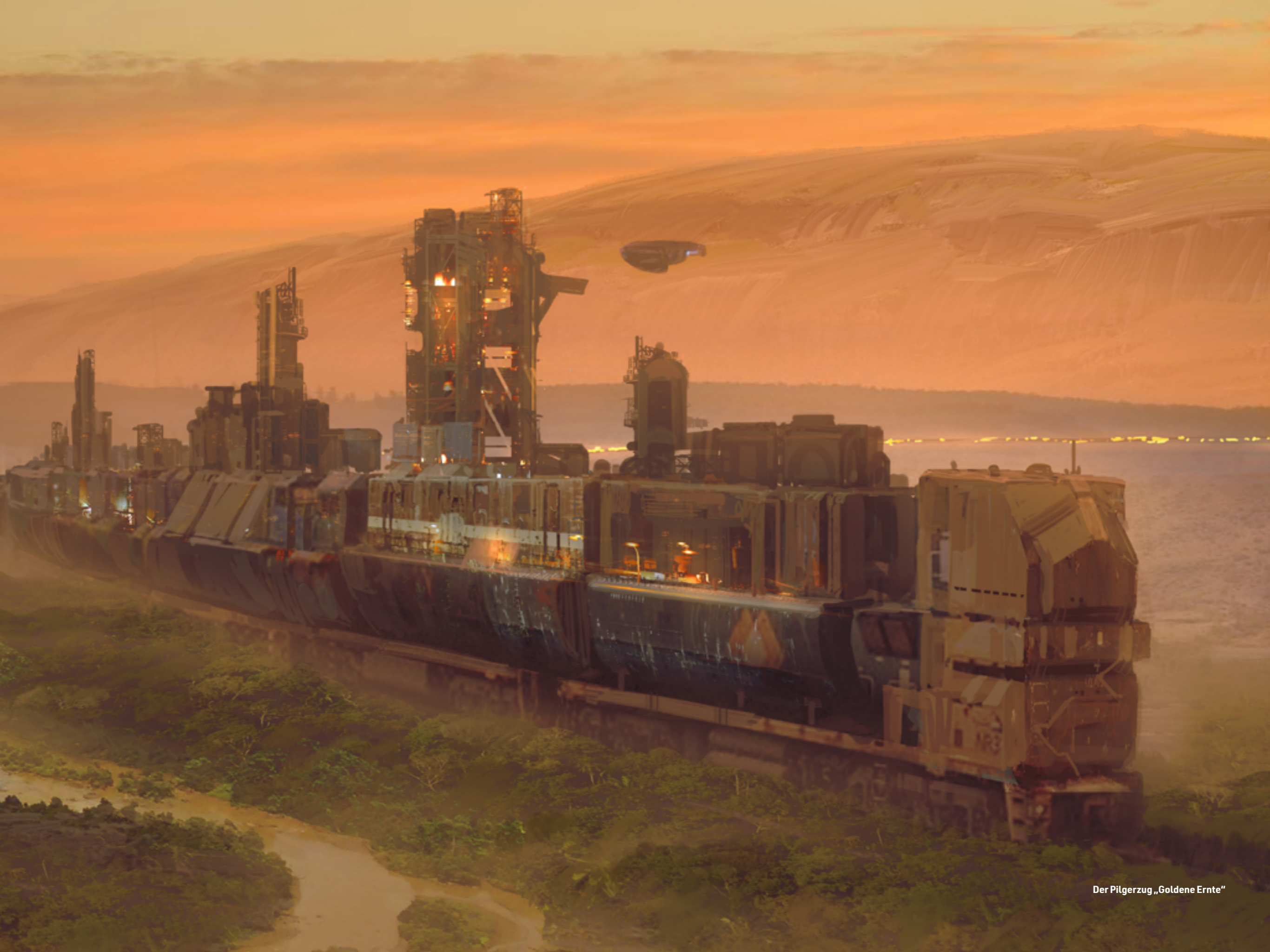
Der Pilgerzug „Goldene Ernte“