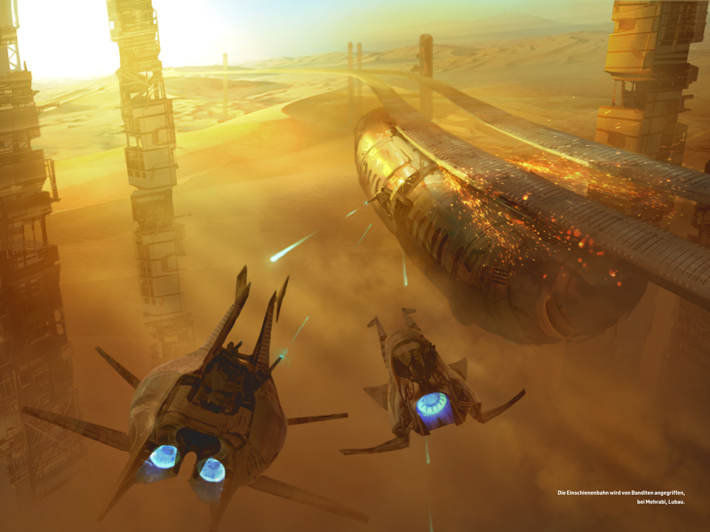
Die Einschienenbahn wird von Banditen angegriffen, bei Mehrabi, Lubau.