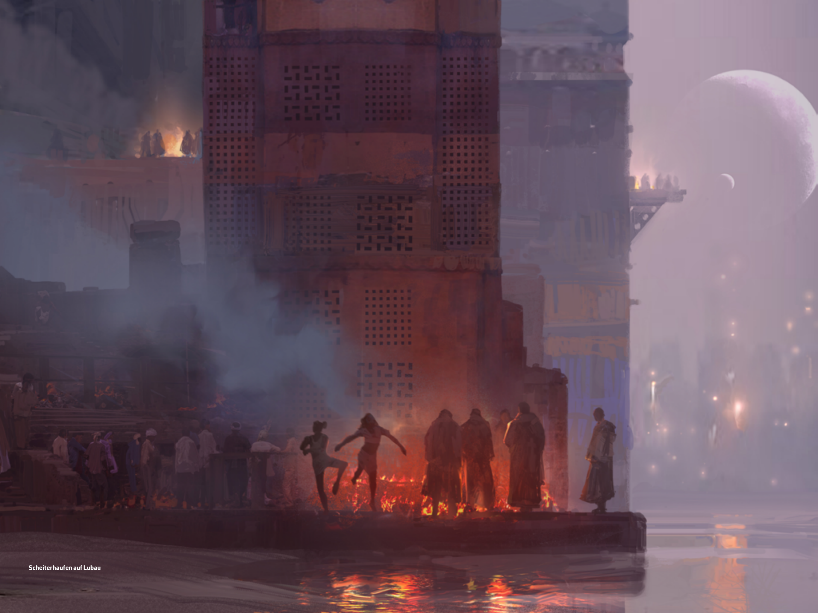
Scheiterhaufen auf Lubau