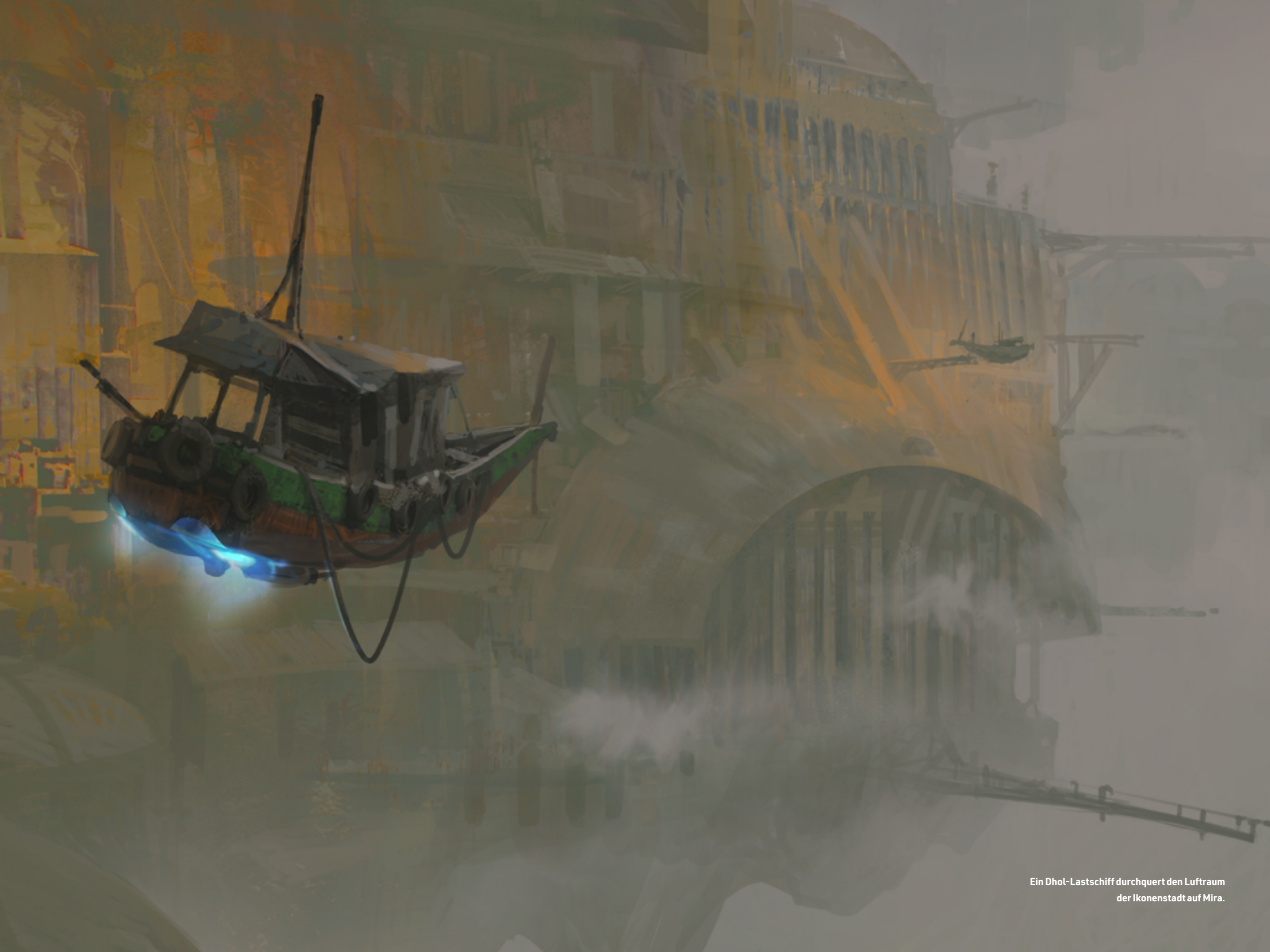
Ein Dhol-Lastschiff durchquert den Luftraum der Ikonenstadt auf Mira.