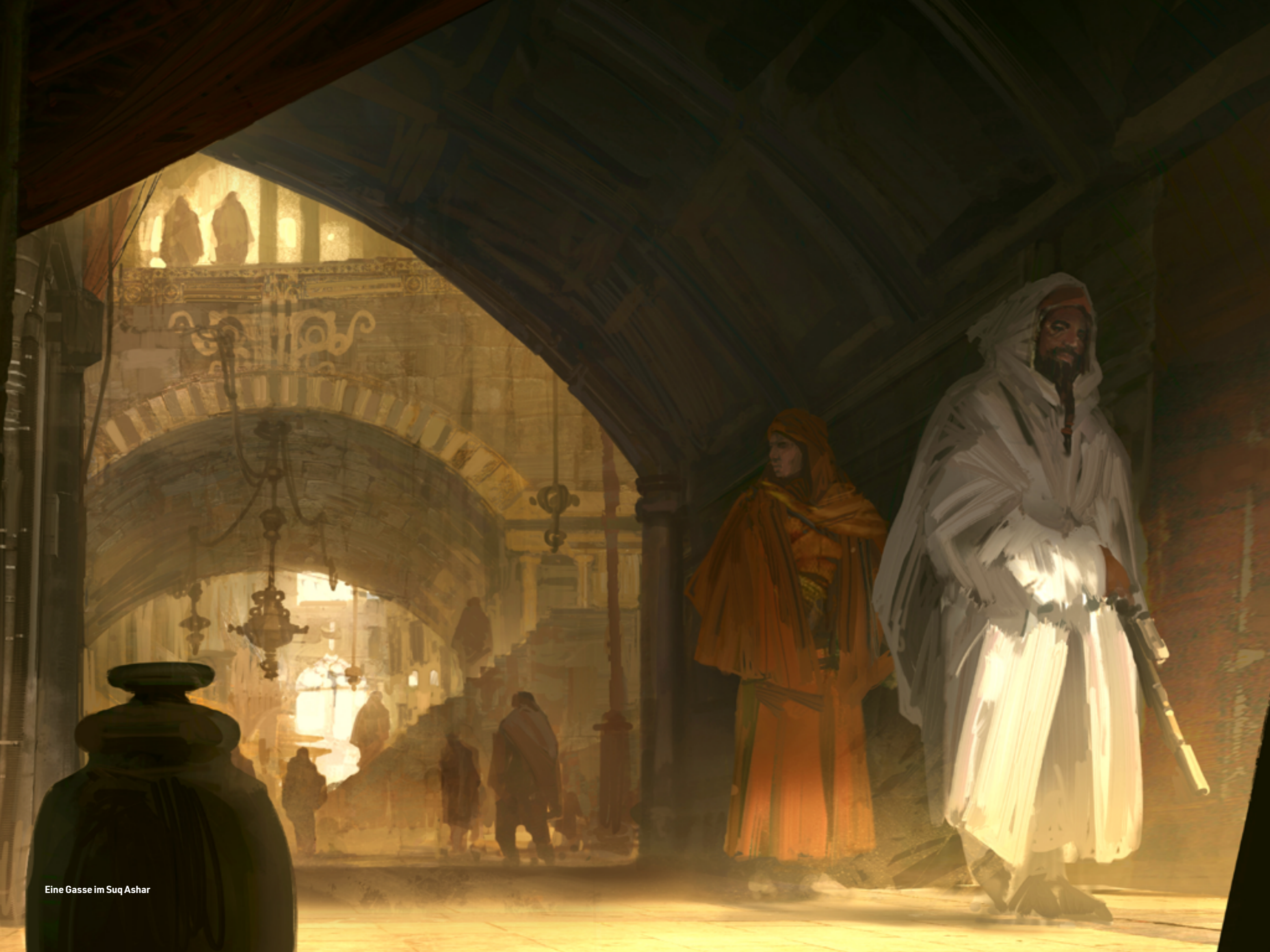
Eine Gasse im Suq Ashar