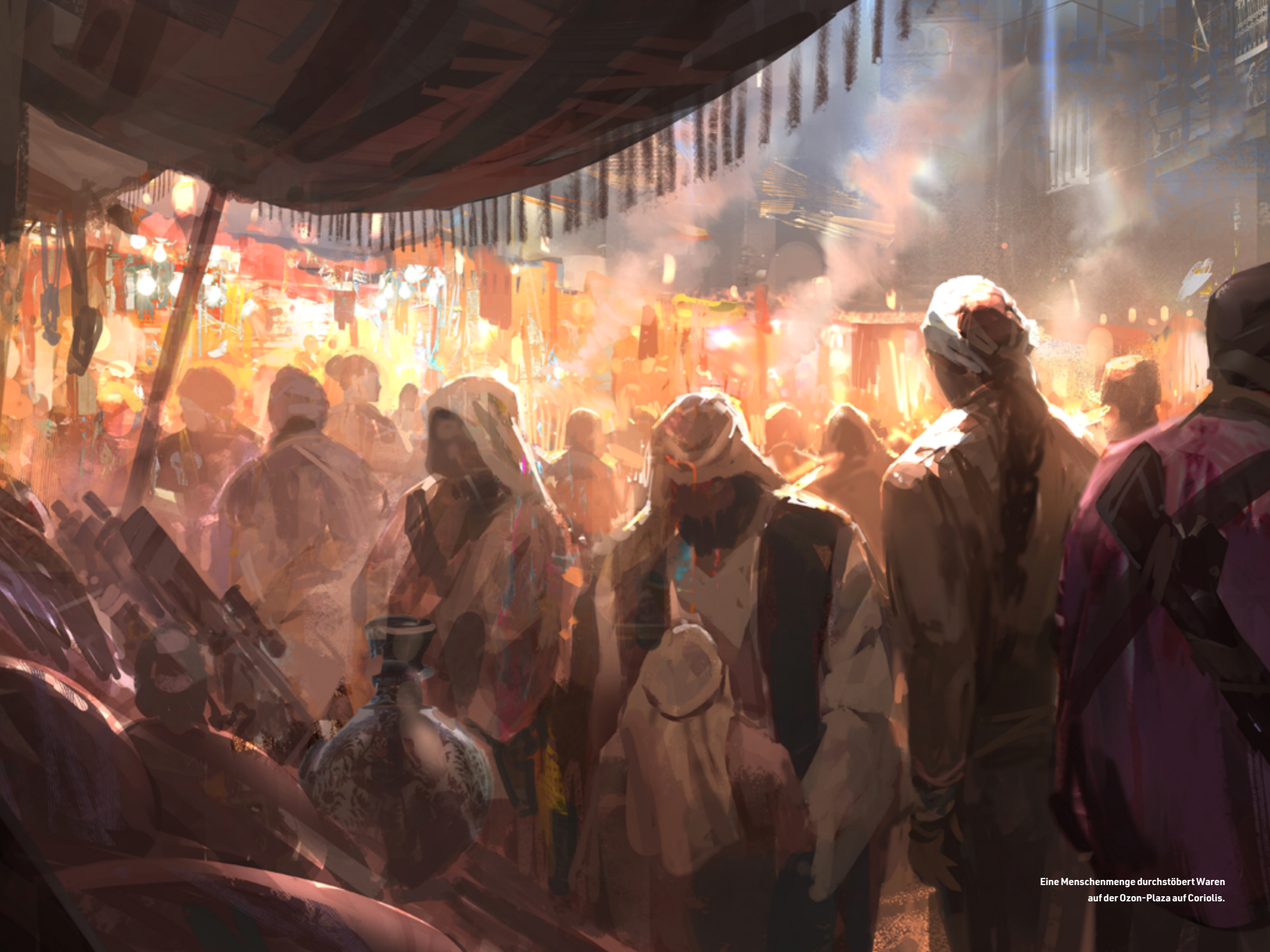
Eine Menschenmenge durchstößt Waren auf der Ozon-Plaza auf Coriolis.