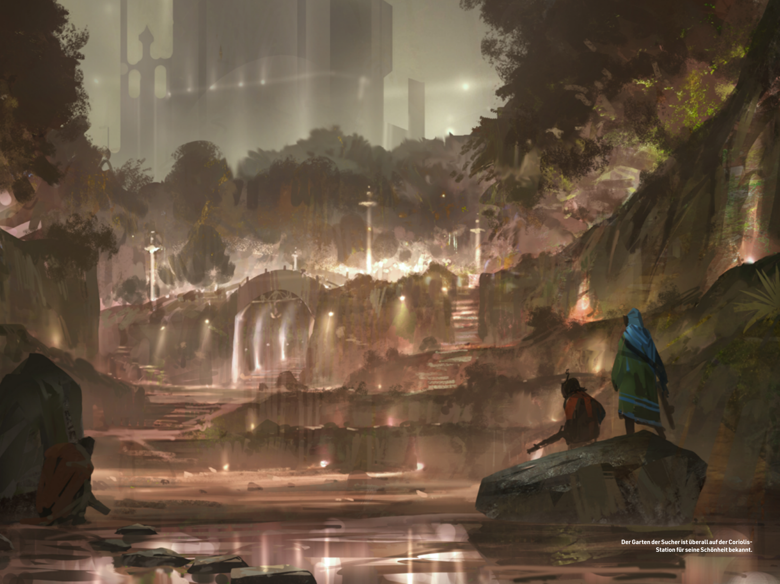
Der Garten der Sucher ist überall auf der Coriolis-Station für seine Schönheit bekannt.