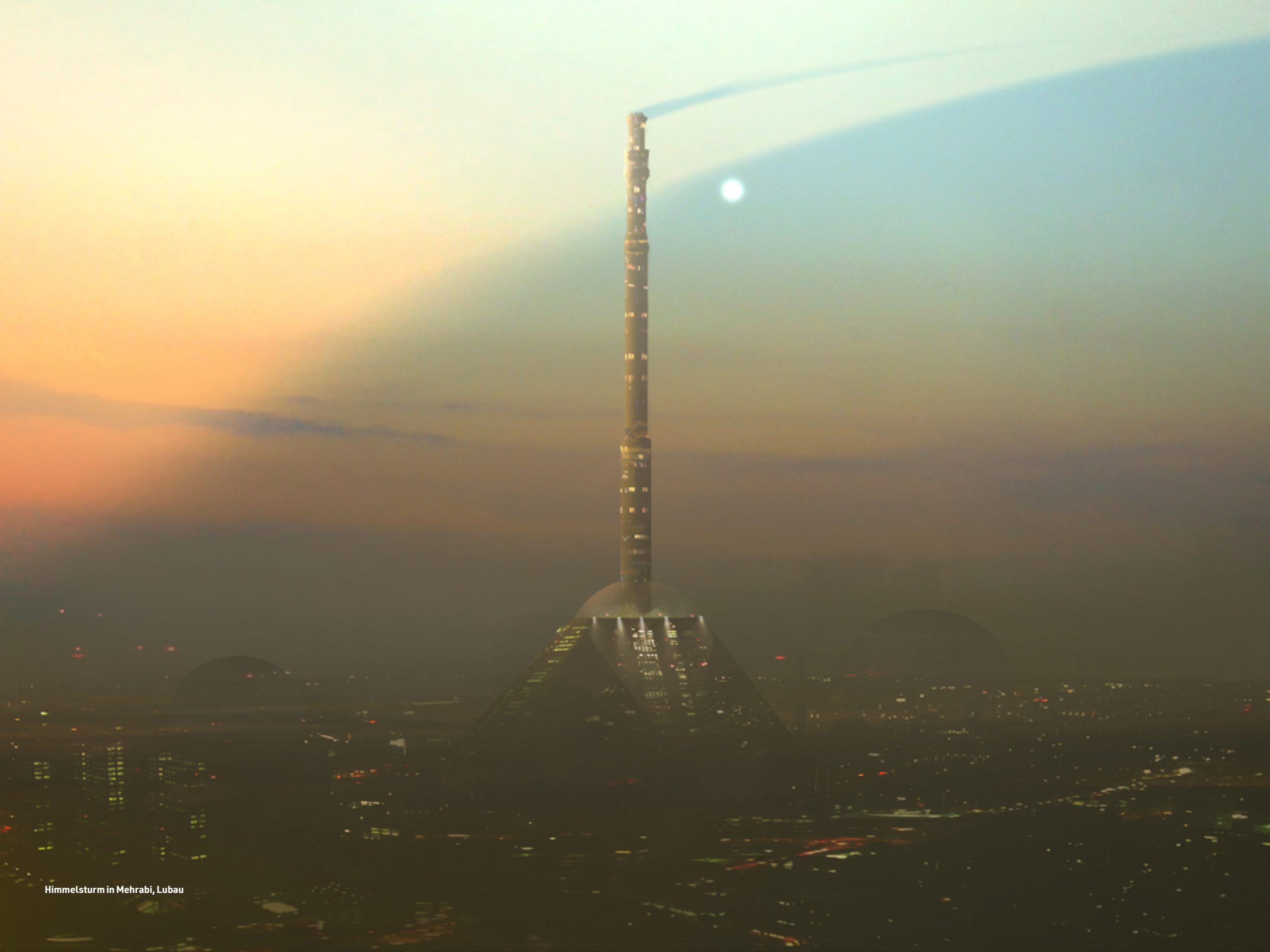
Himmelsturm in Mehrabi, Lubau