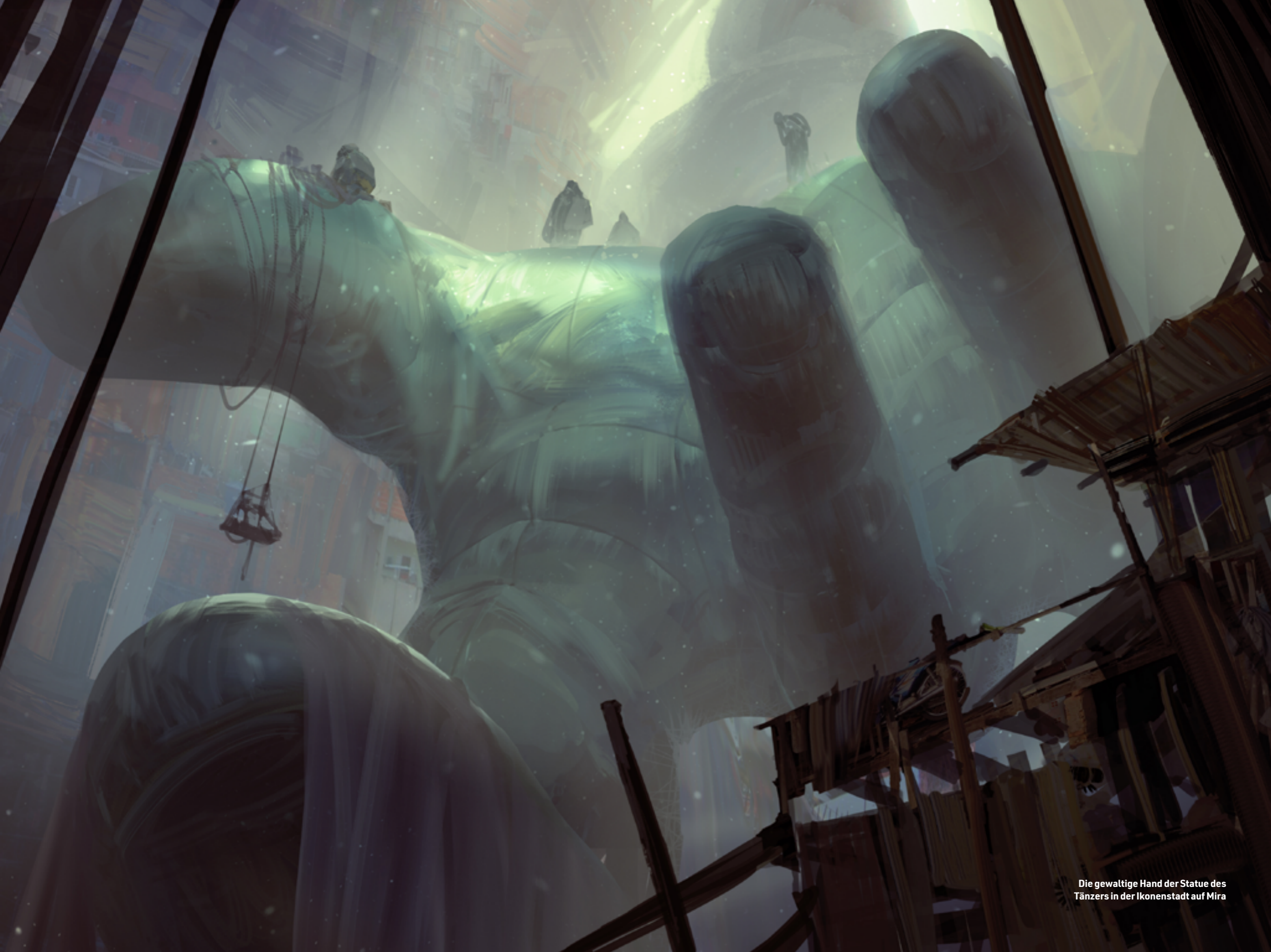
Die gewaltige Hand der Statue des Tänzers in der Ikonenstadt auf Mira