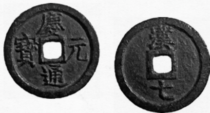
Pièce de monnaie. XII e siècle Nord de la Chine

Deux figurines miroir. L'artiste recherche la symétrie en tout point, excepté pour ce que les personnages tiennent en main.