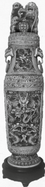
Vase en ivoire Fin du XVII e siècle

Vase de 36 cm orné de dragons. On ignore sa véritable fonction.