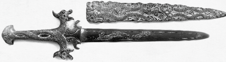
Dague rituelle mandchoue. XVI e siècle Côte Mandchoue

Une lame de bronze gravée de deux serpents.