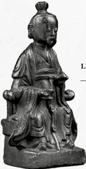
L'Écorcheur Céleste. Figurine de bronze. Époque Ch'in. III e siècle av. J.-C.

Le coursier des dieux est porteur de funestes nouvelles.