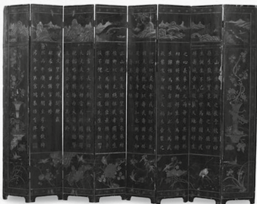
Paravent chinois. XVIII e siècle. Côte de la mer Jaune.

Paravent laqué huit fois et tracé de caractères chinois.