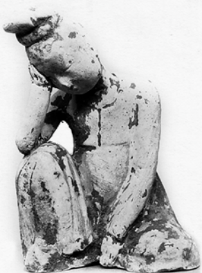
Danseuse au repos. XVIII e siècle. Région de Pékin.

Les artistes sont souvent représentés en représentation et les danseurs virevoltants. Il est rare d'observer une danseuse au repos.