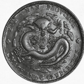
Le Messager des Tourmentes. Médaillon du XIX e siècle. Province du Yunnan

Une lame de bronze gravée de deux serpents.