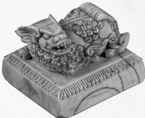
Dragon en ivoire. XVI e siècle.

Les artistes sont souvent représentés en représentation et les danseurs virevoltants. Il est rare d'observer une danseuse au repos.