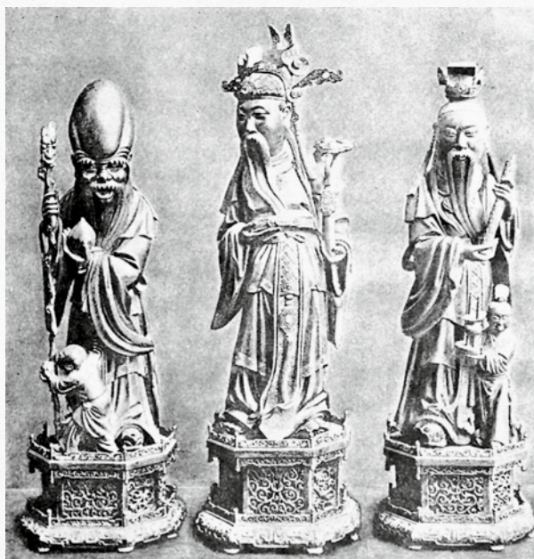
Les seigneurs des trois mondes Date inconnue. Région de Pékin

Vase de 36 cm orné de dragons. On ignore sa véritable fonction.