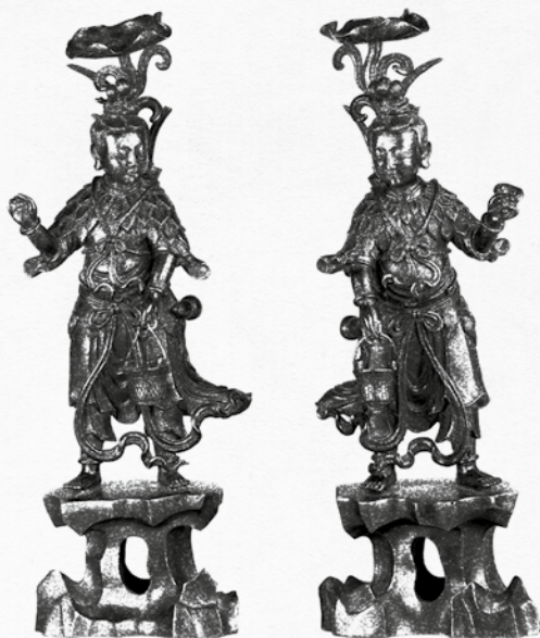
Figurines en bronze. XVII e siècle 34 cm. Nord de la Chine

Deux figurines miroir. L'artiste recherche la symétrie en tout point, excepté pour ce que les personnages tiennent en main.