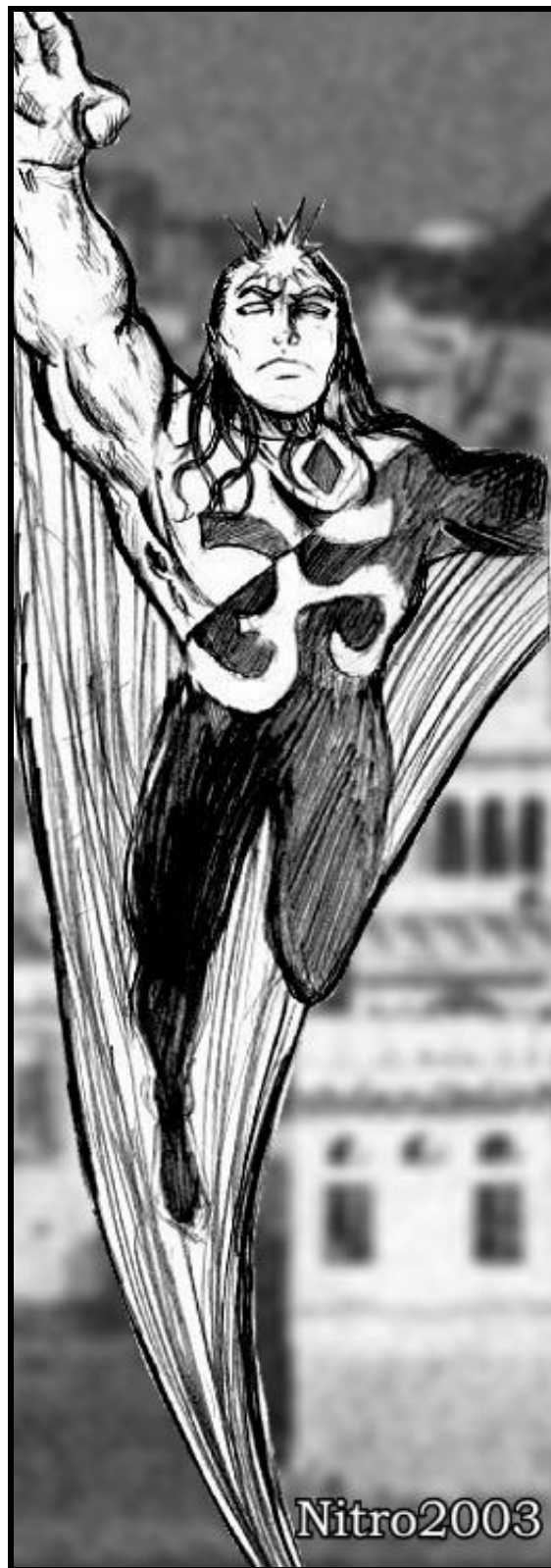
Krishnaman voando sobre os céus de Adyar, Índia.