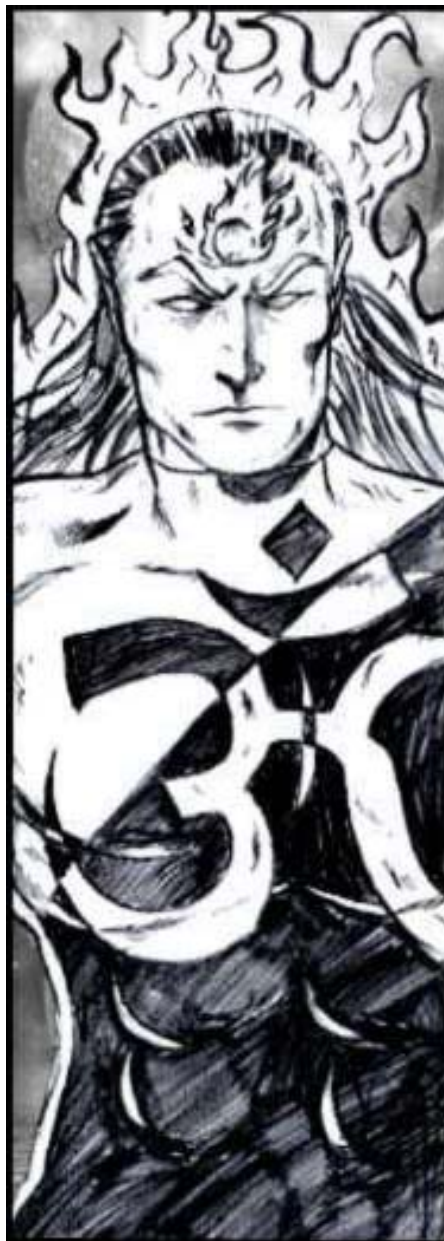
KRISHNAMAN, LÍDER DA KARMA POLICE

Perícias: Computação 30%, Escutar 30%, Esportes 30%, Meditação 40%, Investigação 30%, Liderança 50%, Jogos [Videogames] 40%, Idiomas Condução (carros) 45%, Etiqueta: 40%, Diplomacia 80%, Religião 60%, Idiomas: (Hindi, Francês, Japonês, Espanhol, Chinês e Russo) 50%,